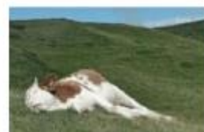
Залишки мертвих тварин

Звертай увагу на інші ознаки небезпечних територій