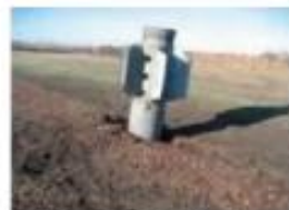
Ознаки бойових дій/військової діяльності