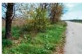
Узбіччя доріг, ґрунтові дороги та лісосмуги

Звертай увагу на інші ознаки небезпечних територій