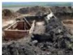
Місця дислокації військових та різні фортифікаційні споруди

Більша частина небезпечних територій не має попереджувальних знаків