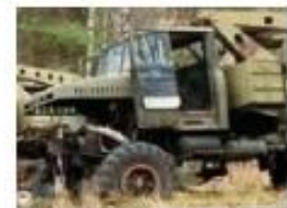
Залишення бойової техніки та транспорт